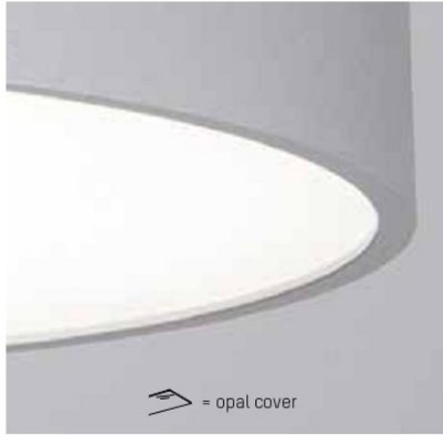
= opal cover