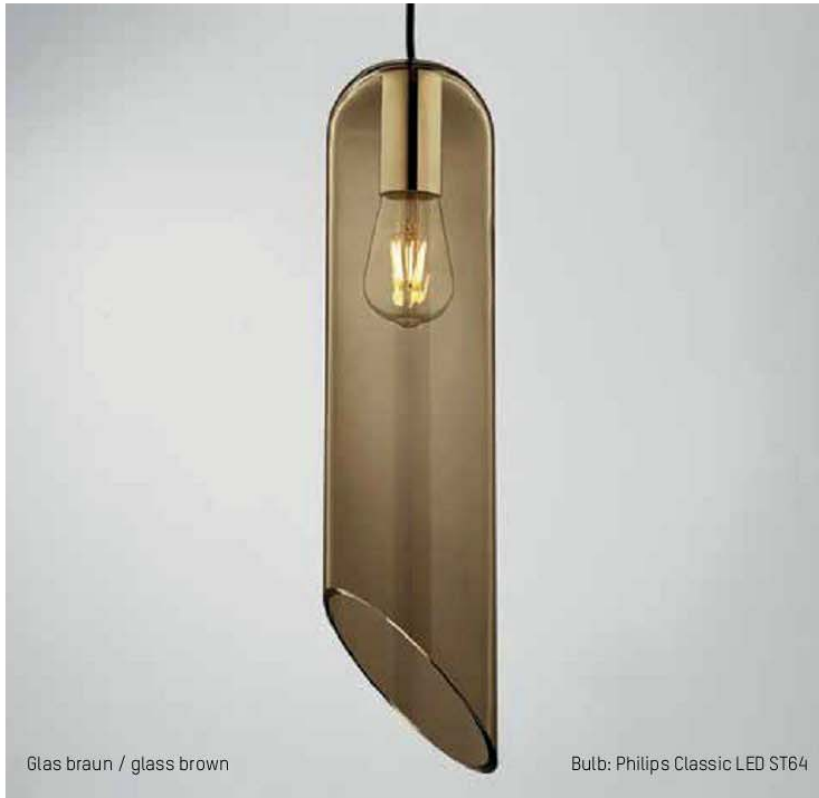
Glas braun / glass brown