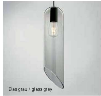
Glas grau / glass grey