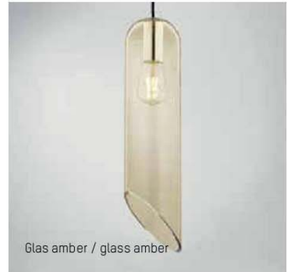
Glas amber / glass amber

Dekorative Hängeleuchte im Retro-Design Hochwertiger Glasschirm mundgeblasen in 3 Farben Speziell konstruierte Fassung für bündigen Montage Abhängung in 2 Farben erhältlich Glasschirm separat ordern